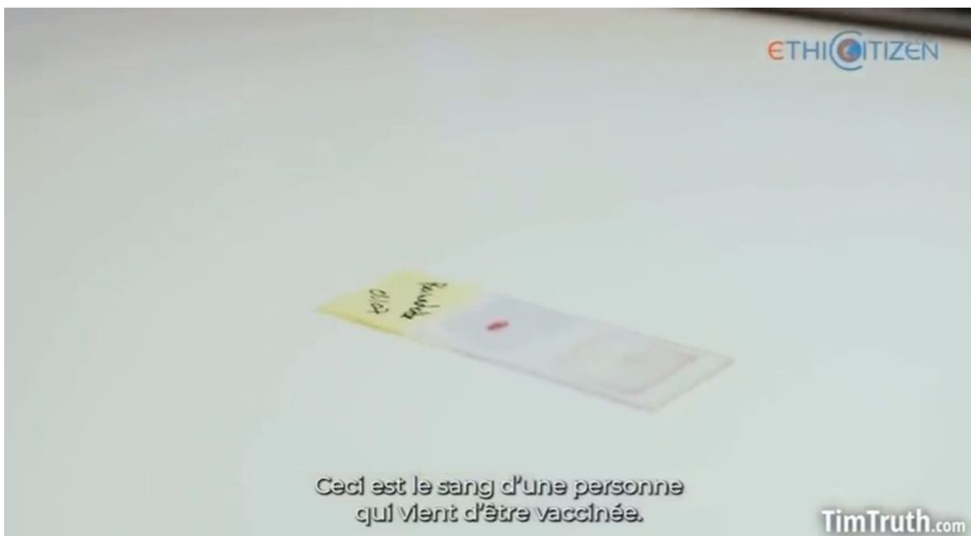
Krevní vzorek očkované osoby

Když tam v první polovině 80. let dělali dětem ve školách IQ testy, Sheffield byl na tom o poznání daleko hůře než školy v ostatních britských městech. Přestože důvody byly kladeny sociálním podmínkám v Sheffieldu, ekonomická situace v jiných britských městech byla mnohde daleko horší, třeba v Leedsu anebo v Manchesteru, kde byla nezaměstnanost skoro dvakrát větší než v Sheffieldu. Jedna z teorií zmiňovala právě dopady nedostatku čerstvého vzduchu na rozvoj mozku dětí v zaprášeném Sheffieldu.