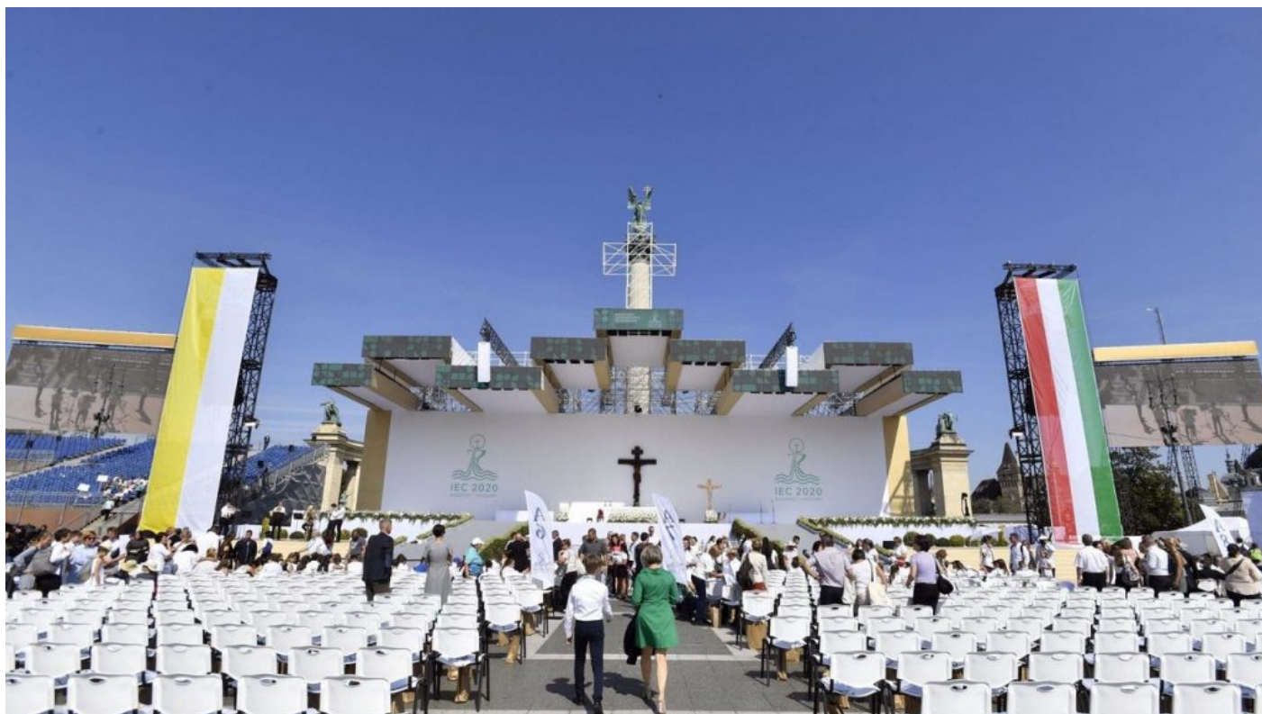
Papežské pódium v Budapešti

Pracovník technických služeb, který se podílel na montáži a konstrukci pódia pro hlavu církve totiž nafotil naprosto neuvěřitelnou věc. Ten mohutný masivní kříž s Kristem je totiž okultní symbol. Dole pod nohama Krista byla na kříži přibitá lidská lebka obrovským hřebem a okolo kříže byl stočený had, který tuto lebku slastně a s uspokojením olizuje. Během mše nikdo z věřících tuto lebku a hada neviděl, protože spodní část kříže byla zakryta papežským stolcem s vysokým opěradlem, které zakrývalo tyto dva okultní symboly, které na kříž s Kristem nepatří.