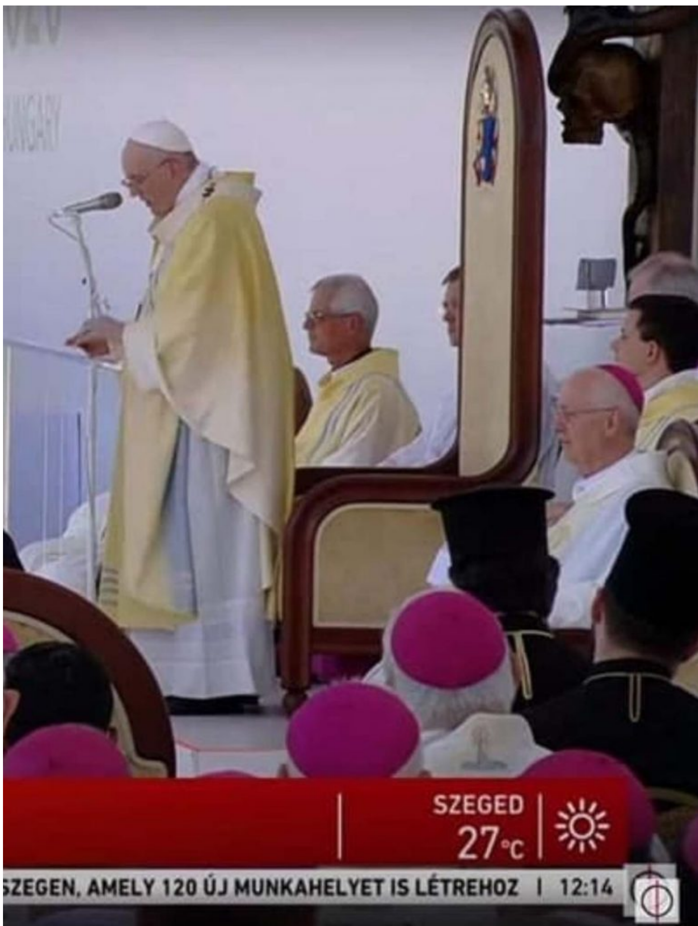
Televizní záběr stolce z boku. Lebka na kříži za opěradlem stolce je dokonale vidět