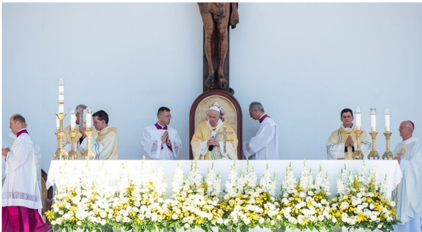
Papežské pódium v Budapešti

Tohle je naprosto nejotřesnější důkaz toho, v čem jede tato osoba, která na sebe natáhla papežský oděv, protože ve chvíli, kdy Vatikán začne razit Luciferiánství, v tom okamžiku evropská civilizace skončila a poslední může zhasnout. Nemyslete si, že všechno, co se teď okolo vás děje, že je náhoda. Všechno je to součástí plánu a Vatikán je hlavním sídlem okultních procesů řízení, tedy těch vůbec nejvyšších. Takže sami teď víte, kde se teď nachází církve. A sami se podívejte, kde a jak má skončit člověk.