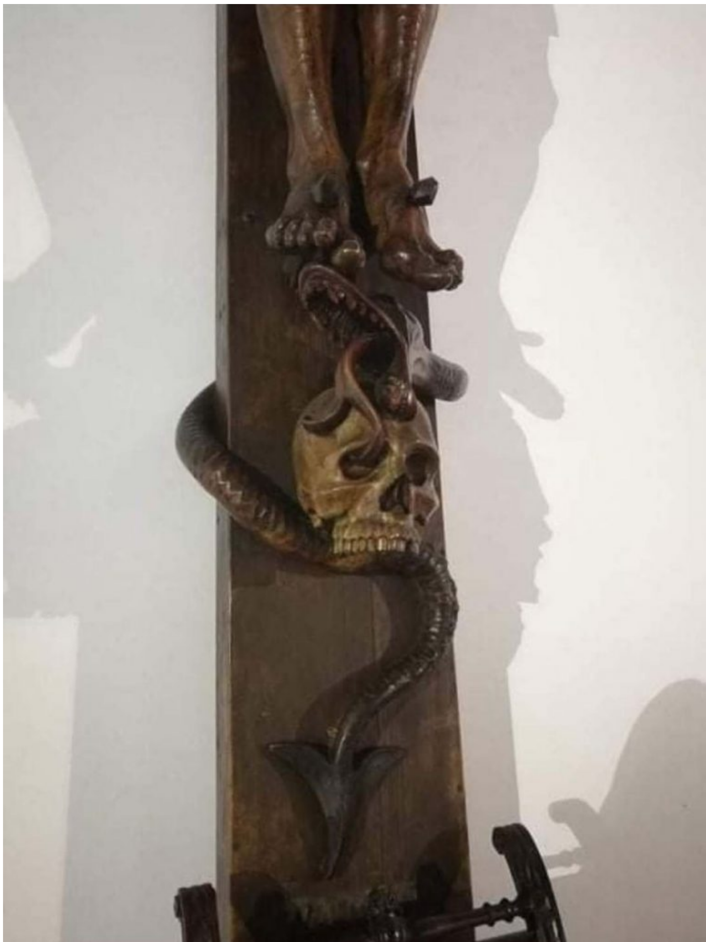
Detailní záběr na hada a lebku