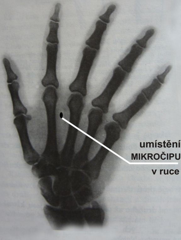
umístění MIKROČIPU v ruce

Je potřeba mít víru. Mnozí si myslíme, že máme silnou víru, tak jako Petr, když vstoupil na vodu, aby po vodě došel ke Kristu. I šel kousek, ale začal klesat ke dnu. Takoví jsme všichni, tak nám bylo ukázáno, jací jsme. Ne proto, abychom se styděli, ale proto, abychom se snažili. Lid Izraele v čele s Mojžíšem musel mít také víru, aby jim Bůh vytvořil suchou cestu přes moře a tak mohli putovat na příslibené místo. Tentokrát to bude obdivuhodnější, protože se hůř představuje v naší mysli to naše davové vyzdvižení do Nového Ráje. Budeme vyzdviženi tak jak jsme, živí, v šatech, aniž bychom umřeli, tak jak se píše v bibli. Ve své podstatě se to v ničem nebude lišit od dřívějších přechodů, jen ve své formě bude jiný.