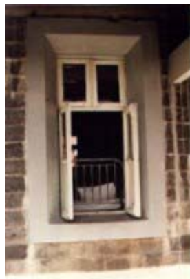
Okno nemocničnej izby

Bol som vyčerpaný a hladný. Prebudil som sa znovu uprostred noci a celý som sa chvel a bol som spotený. Moje srdce bolo plné hrôzy. Ležal som tvárou obrátený ku stene. Otočil som sa, aby som sa pozrel, čo ma to tak desí. Cez moju sieť proti komárom a cez železné mreže na okne som uvidel oči, možno sedem alebo osem párov očí, ktoré na mňa hľadeli. Vyžarovali červené svetielka. Namiesto okrúhlych zreníc mali úzke, ako majú mačky. Zdalo sa, že su napoly ľudské a napoly zvieracie. Myslel som si: „Čo toto, preboha, len môže byť?“ Dívali sa do mojich očí a ja som hľadel do tých ich, keď som vtom počul: „Si náš, my sa vraciame.“ „Nie, nevraciate!“ povedal som. Chytil som svoju baterku a posvietil som na nich. Nič tam nebolo. Ale ja viem, že som ich práve videl!