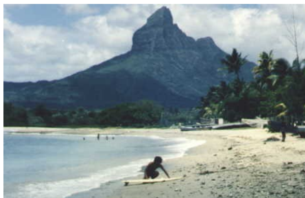
Surfovanie v zátok Tamarin - Mauritius

Na ostrove Réunion som narazil na úžasný surferský príboj zvaný Sv. Leu, kde boli obrovské vlny. Bol marec 1982 a cestoval som už takmer dva roky, často som spal v stane na plážach a žil som ako tulák.