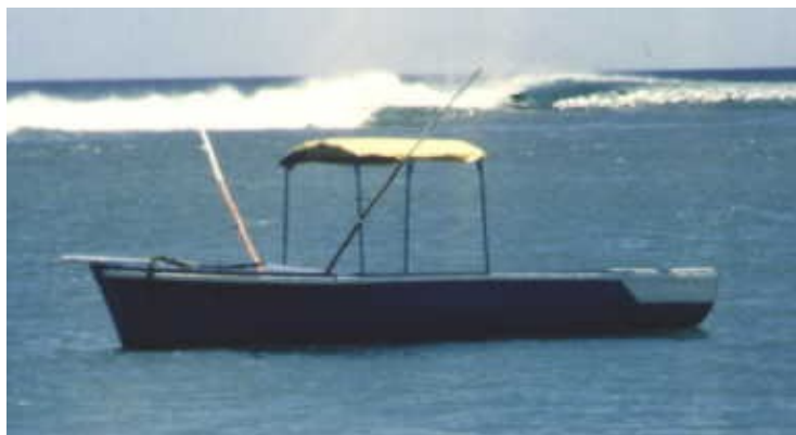
Drevená loďka a vlny na Mauritiu

Moji dvaja priatelia vytiahli loďku na korálový útes, aj so mnou v nej. Dnom drela o korály. Bola to drevená loďka, ktorá im dávala obživu, takže som si uvedomil, aká vážna je situácia, keď niečo takého urobili. Potom loďku spustili na lagúnu, plávali a loďku sa snažili tlačiť pred sebou. Povedal som im: „Podťe so mnou!“, ale oni mi odpovedali: „Nie, sme príliš ťažkí, nech ide s tebou chlapec a vezme ťa na pobrežie.“ Tento mladý chlapec ma v loďke viezol na pobrežie tak, že sa tyčou odrážal energicky od dna.