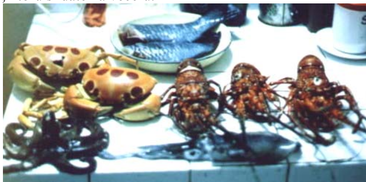
Typický zber z mora

Na tomto ostrove som žil v „Tamarin Bay“ (bay – zátoka) medzi miestnymi lovcami krabov a surfermi. Prijali ma do svojich životov a naučili ma potápať sa v noci pozdĺž útesov. Nočné potápanie je úžasná skúsenosť. Krabi vyliezajú v noci a môžete ich svojou baterkou oslepiť a veľmi jednoducho si ich vziať. Ryby v noci spia a tak si môžete vybrať, ktorú si dáte na večeru.